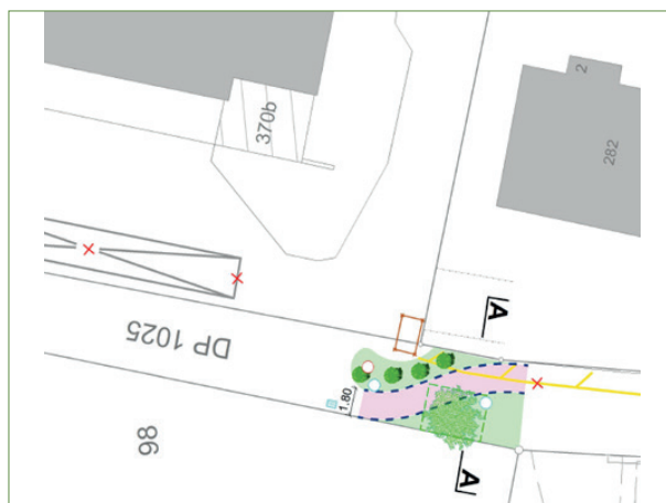
Création de la fermeture du chemin du Pontet avec maintien de la circulation piétonne et vélos