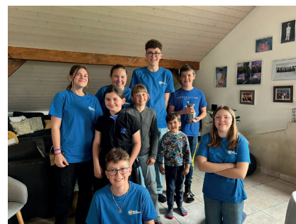
Le Comité d'organisation entourant les vainqueurs lors du goûter